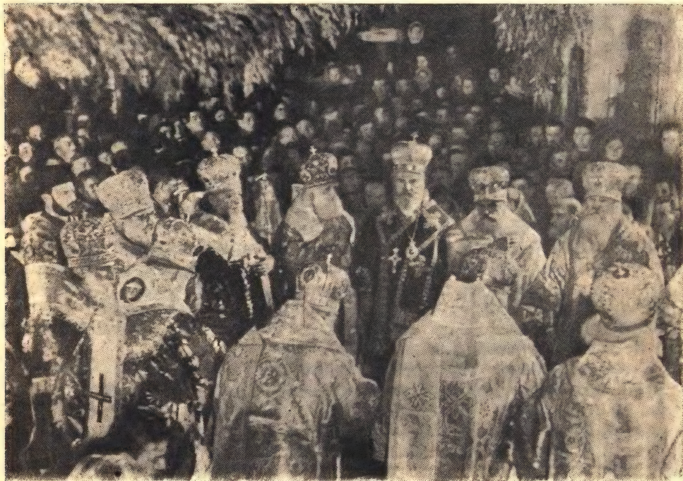
Святейший Патриарх Алексей в сослужении представителей автокефальных Православных Церквей Востока за Божественной Литургией в день своей интронизации.